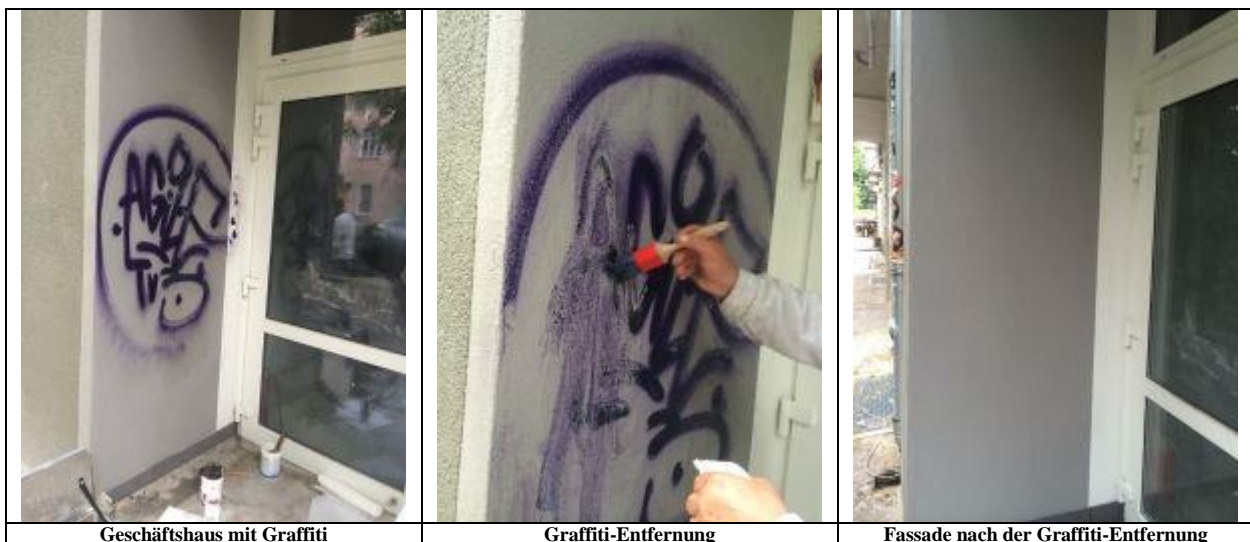
Geschäftshaus mit Graffiti

Auch wenn man es ihm nicht ansieht, dem renovierten Bahnhof der Stadt Brandenburg an der Havel, so ist die Fassade vollständig mit WDVS eines großen Herstellers gedämmt und mit einem 2 mm Silikonharzputz und Silikonharzanstrich versehen. Bis 3 Meter Höhe wurde die Fläche rings um das Gebäude mit Scheidel HydroPurSilan ® – Matt – GRAFFITI-SCHUTZLACK geschützt. Durch das matte Erscheinungsbild des Graffitischutzlackes fällt die Beschichtung kaum auf. Die Verwendung von HydroPurSilan ® ist aufgrund der guten Wasserdampfdurchlässigkeit der Klasse 2 (sd-Wert 0,46 m) auf Wärmeschutzfassaden völlig unproblematisch.